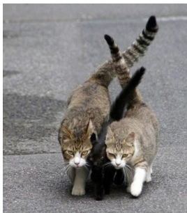
Obrázek: O dvou policajtech

Příklad: Ukažte, že \lim_{(x,y) \rightarrow (0,0)} \frac{x^2}{\sqrt{x^2+y^2}} = 0 .